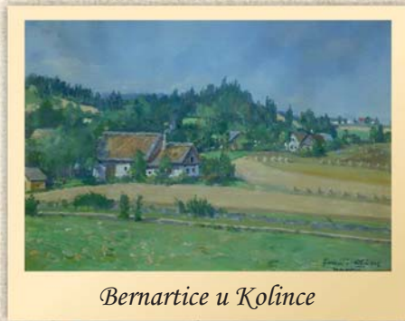
Bernartice u Kolínce