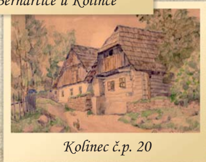
Kolínek č.p. 20