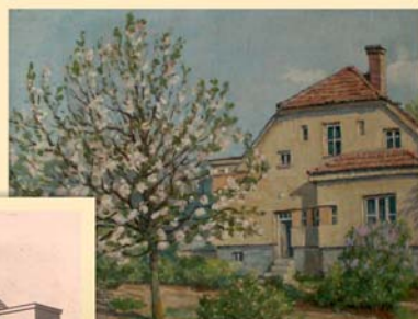
Kolínec čp. 202