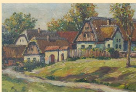
Báčetín č.p. 26