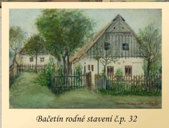
Bačetín rodné stavení č.p. 32