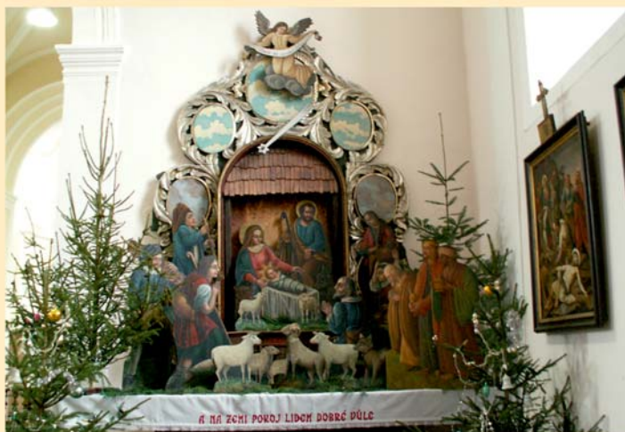
Betlém v Kolinci