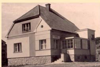
Kolínec čp. 202