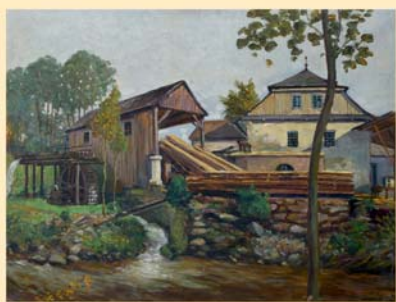
Píla v Habrové

V roce 1926 namaloval obraz do bačetiňské školy a na zadní stranu plátna napsal věnování.