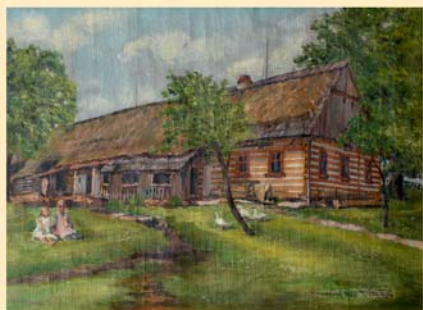
Bohdašín č.p. 6

Celestin Matějů se věnoval především krajinné malbě. Ve své době byl velice oblíbený. Poznáváme to z množství obrazů zachycujících nejrůznější místa severovýchodních Čech (Svatoňovice, Babiččino údolí, vesničky v Orlických horách), které se ještě dnes často nacházejí ve zdejších domácnostech. Dostávaly se sem při různých příležitostech, např. jako svatební dary.