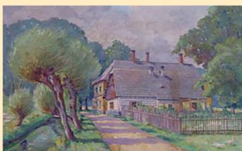
Staré bělidlo Babiččino údolí Ratibořice