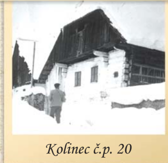
Kolínek č.p. 20