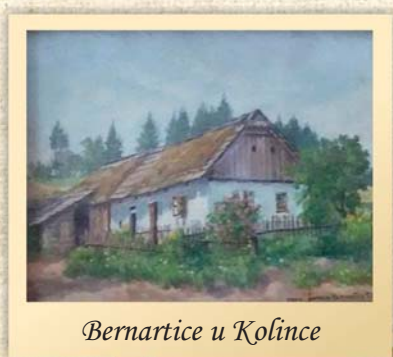
Bernartice u Kolínce

Zde v Kolinci namaloval řadu obrazů. Většinou to byly miniatury, kterými obdarovával své známé. Často svými obrazy platil protislužby, jelikož jeho příjmy byly velmi malé.