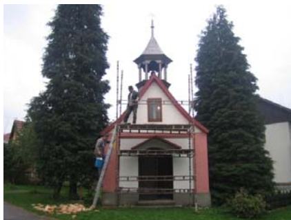
Umístění Madonny do výklenku kapličky v Sudíně - 2006

(Jan a Radomil Ježek)