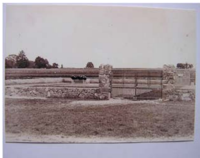
Foto hřbitova v Bačetiňě, červen 1954, před dokončením stavby