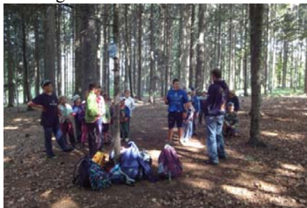
Hry v lese

Přesto, že počasí dodalo vedra větší než příjemná, udělala parta dospělých kluků a holek maximum pro úsměvy dětí. Z obou týdnů jsou krásné snímky k nahlédnutí ve fotogalerii na webu OÚ Bačetín.