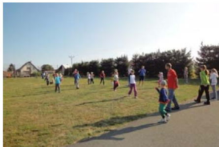
Rybičky, rybičky, rybáři jedou....