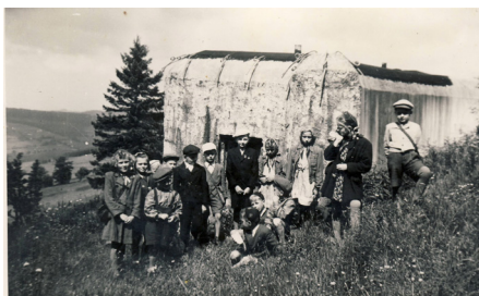
Budova se školáky je Šerlišský Mlýn / Bunkr - opevnění je někde po cestě z výletu