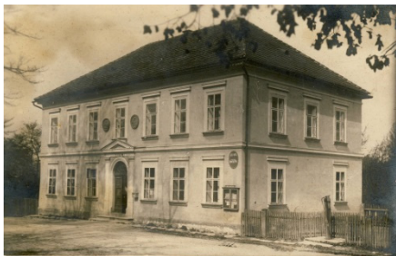
Škola okolo roku 1900