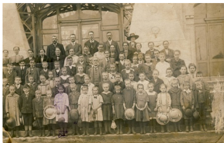
Školní výlet do Prahy 1924