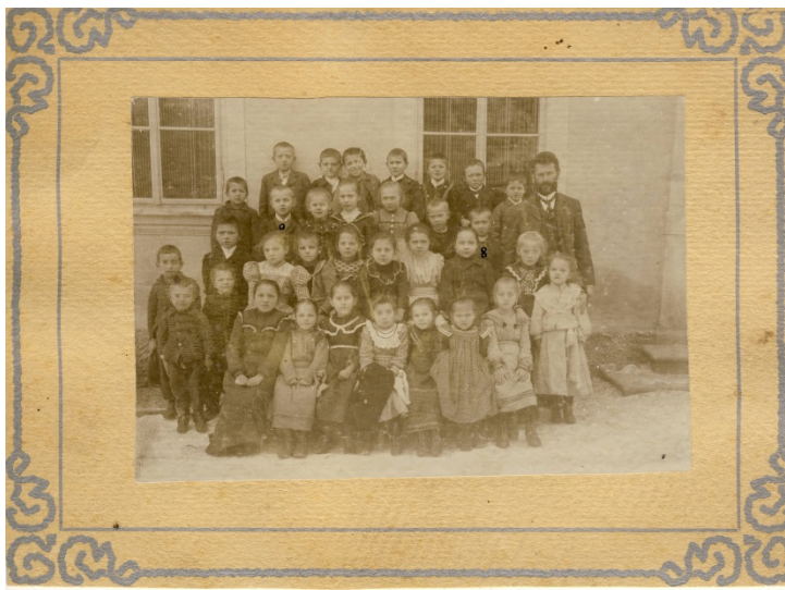
První ročník školy v Bačetíně