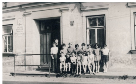
Poslední žáci školy