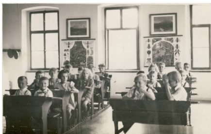
Školní třída v roce 1957