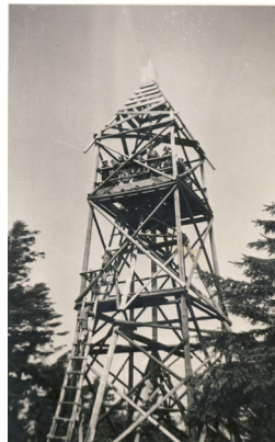
Školní výlet je z roku 1947 nebo 1948. / Rozhledna z Velké Deštné