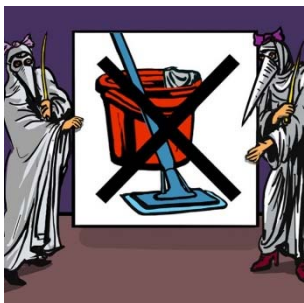
Lucie, noci upije a práci zakáže

odpoledne déle vidět. Přitom však až do slunovratu je východ slunce čím dál později, takže noci se nezkracují.