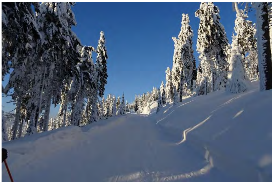
K Zimní cesta z Deštného k Vrchmezi

Byl jsem požádán o napsání jednoho z příspěvků pro vydání letošního výtisku Bačetiňského zpravodaje. Přemýšlel jsem o vhodném tématu a napadlo mě připomenout si, v jakém kraji to žijeme. Myslím, že by nám mnozí z jiných částí republiky, natož z okolních států dnes rozbouřeného světa, mohli i závidět. Ta pestrost a rozmanitost krajiny na malém území se mi nevidí tak často. Stačí se postavit na kopec nad Sudínem a rozhlédnout se kolem. Při pohledu na východ se krajina ostře mění, nejprve údolím Zlatého potoka /Dědiny/, dále zvedajícími se svahy přecházející do horského terénu, až po nejvyšší hřeben pohraničních Orlických hor. To vše ve velmi blízké vzdálenosti. Při pohledu opačným směrem, západním, vidíme zcela opačný charakter území. Pozvolna klesající krajinu do nížin, s pohledem do níže položených obcí a měst, až k Hradci Králové. Severněji pak opět změna, vodní nádrž Rozkoš u České Skalice, které se také říká Východočeské moře.