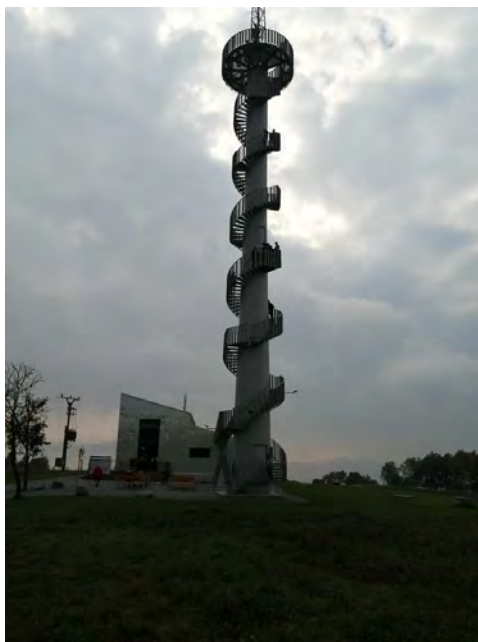
Rozhledna nad Novým Hrádkem

Mnozí se o dovolených vydávají na dlouhé cesty do zahraničí, k moři, do vzdálených zemí apod. Je zcela přirozené, že člověk chce poznat něco, co doma nemá a pokud je možnost, tak to dělá většina z nás. Ale také je dobré si připomenout, že v našem okolí je mnoho pěkného, co stojí za to shlédnout.