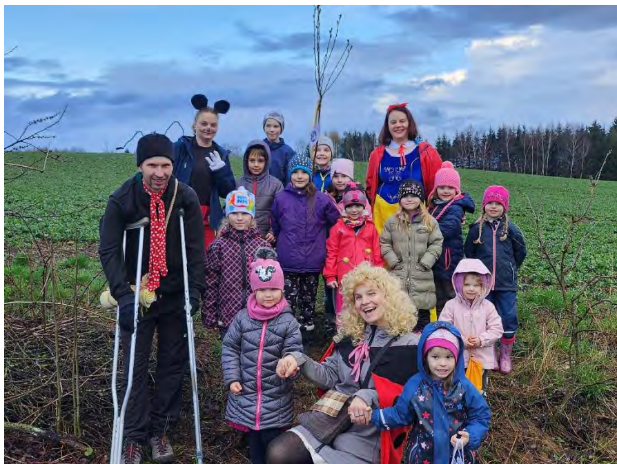
Beruška, Ferda Mravenec, Sněhurka a Myšák Mickey