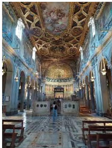
bazilika sv. Jana v Lateranu s hrobem Jana Křtitele

Ubytovali jsme se v České koleji v Římě, která se jmenuje Nepomucenum (od roku 1929), kde jsou ubytováni během svých studií nejen seminaristé a kněží z Čech, ale třeba i jeden Slovák, který studuje v Římě operní zpěv.