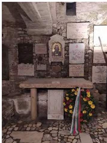
hrob sv. Cyrila s deskami a květinami od slovanských národů

I manželé mohou snadno zapomenout na to, co si slíbili při svatbě. Že si slíbili lásku, úctu a věrnost. Na těchto třech pilířích je třeba stavět každý den, aby manželství bylo vydařené. Když se tento základní tandem