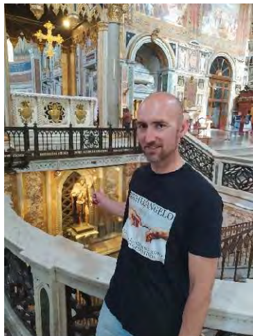
bazilika sv. Klementa nad hrobem sv. Cyrila